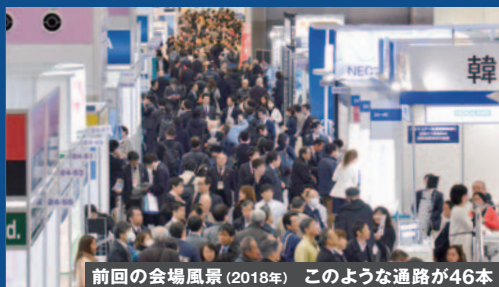
前回の会場風景(2018年) このような通路が46本