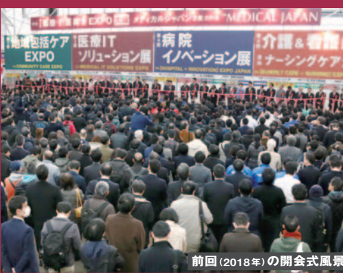
前回(2018年)の開会式風景