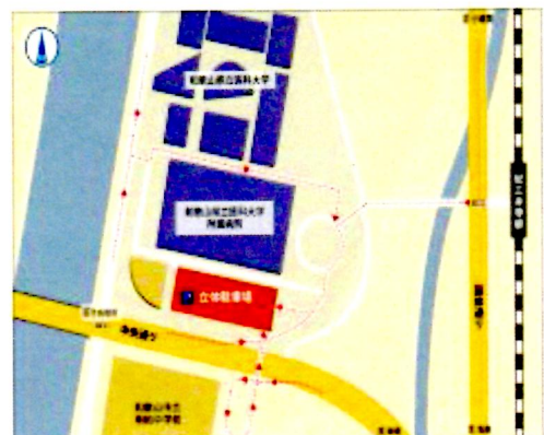
【駐車場へのアクセス】