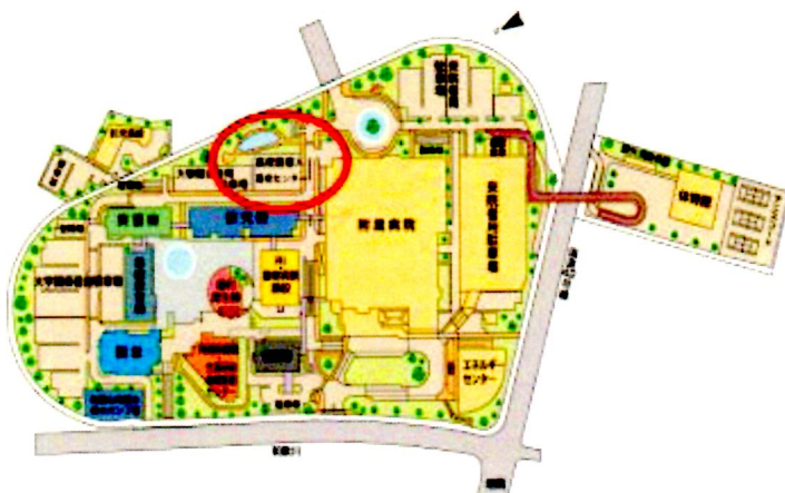
【和歌山県立医科大学 高度医療人育成センター】